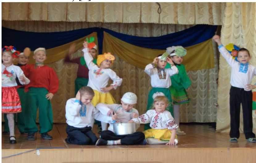
Рис. 2. Виступ членів артстудії «Арлекін»

костюмів, оформляти афіши, запрошення; використовувати позитивні прийоми спілкування з однолітками у процесі планування гри, її ходу (перехід з ігрового плану в план реальних взаємин) [9].