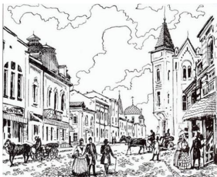
Вулиця Михайлівська наприкінці XIX ст.

До того, як отримати теперішню назву, вулиця називалася Пилипонівською. Все тому, що виникла вона на місці поселення старообрядців пилипонів, яке являло собою невелике село на тодішній околиці міста. Архітектурно воно нітрохи не було схоже на сьогоднішню вулицю – було забудоване одноповерховими дерев'яними будинками, які оточувалисягородами. На початку 1850-х років за наказом губернатора Синельникова пилипонів було відселено за межі міста. А на місці села Пилипонівка розпочалося утворення сучасної вулиці з 2 – 3-поверховими будинками європейського зразка. Чому ж вулицю перейменували на Михайлівську?