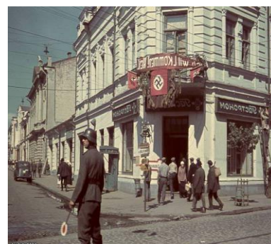
Вулиця Михайлівська. 1941 рік