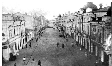
1939. Вулиця заасфальтована. Жодного дерева ще не має. Кожен будинок прекрасно проглядається.

У 1936 році першою у Житомирі вулиця була заасфальтована, після чого стала головною святковою вулицею міста, де відбувалися першотравневі та жовтневі демонстрації і паради.