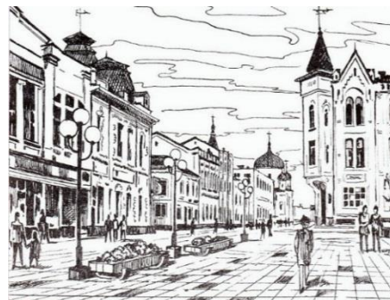
Вулиця Михайлівська на початку XX ст.