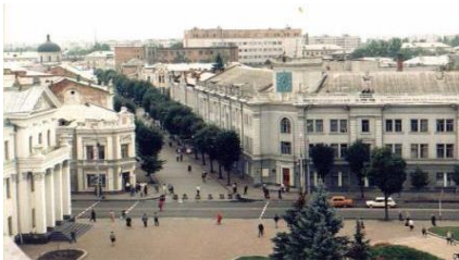
Вулиця Михайлівська. 1990

«Михайлівська один в один повторює характер свого міста: вона скромна і, на перший погляд, непоказна, але ошатна, близька за масштабом людині. Вона – наче вітальня у затишній квартирі старої інтелігентної сім'ї. Тут всього потроху, в міру, зі смаком. Можете, якщо хочете, назвати її візитівкою Житомира. Можете – житомирським «Монпарнасом» або «Дерибасівською». Адже тут-таки на початку ХХ століття діяли театри і концертні зали, лунала музика, вабили до себе городян виставки творів живопису, кінотеатри!.. Феномен Михайлівської і в тому, що вона знаходиться на перетині якихось невидимих «нервів» міста. Куди б ви не йшли, якщо знаходитесь в центрі Житомира, обов'язково потрапите на Михайлівську та й ще, як правило, зустрінете не одного знайомого. Ця вулиця, насправді, душа міста, його серце», – розповідає про вулицю краєзнавець Георгій Мокрицький.