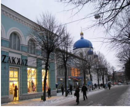
Вулиця Михайлівська 2019 На задньому плані Михайлівський собор