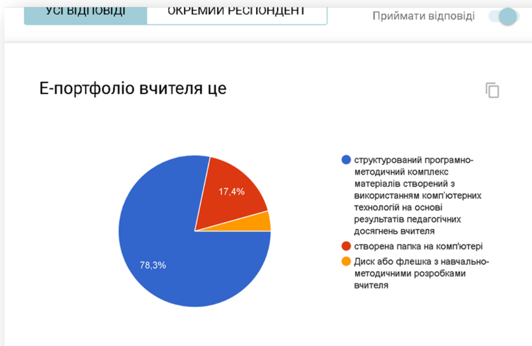
Рис. 2. Результати опитування щодо розуміння педагогами поняття Е-портфолію

За результатами виявлено, що 78,3% опитаних респондентів розуміють сутність поняття Е-портфолію, 17,4% вважають, що це створена папка на комп'ютері, а 4,3% розуміють його, як диск або флешка з навчально-методичними розробками вчителя (рис. 2).